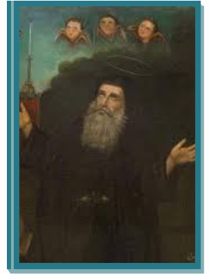
St. Antoine le grand