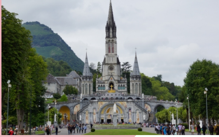
Superficie totale : 2000 m 2

Je voudrais être sûre qu'elle m'aime, la Sainte Vierge.... Quand on pense que j'ai eu tant de mal toute ma vie à dire mon chapelet !