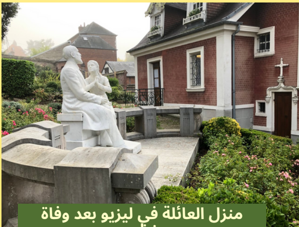
منزل العائلة في ليزيو بعد وفاة زيلي

أعلنا قديسين من قبل البابا فرنسيس في 18 تشرين الأوّل 2015. صلاتهما معنا.